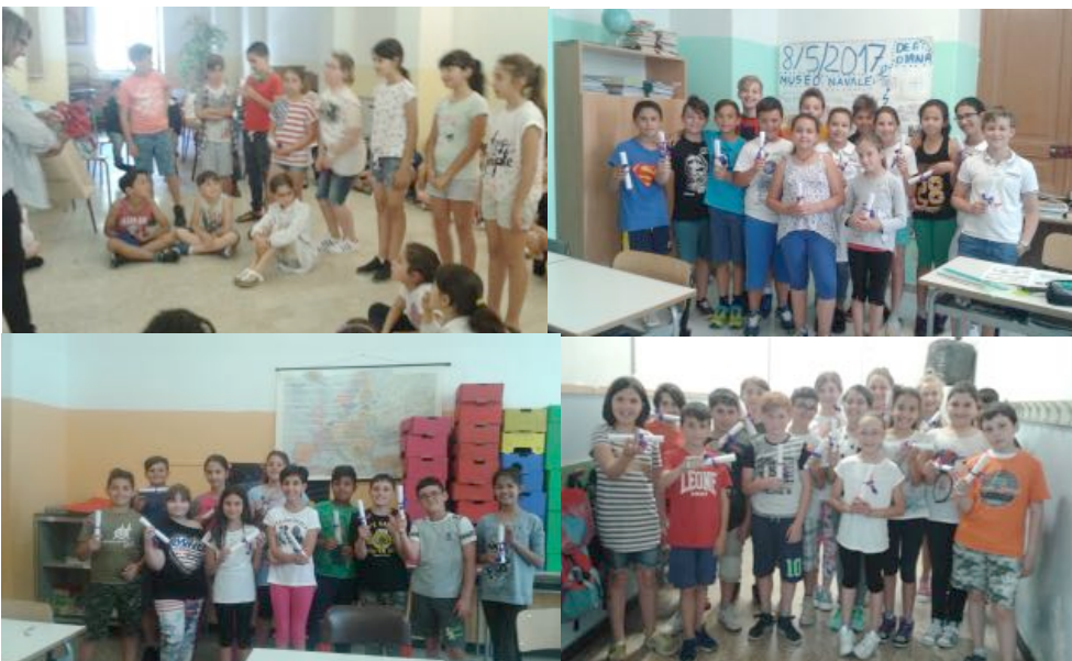
Nelle foto, alcuni momenti della premiazione